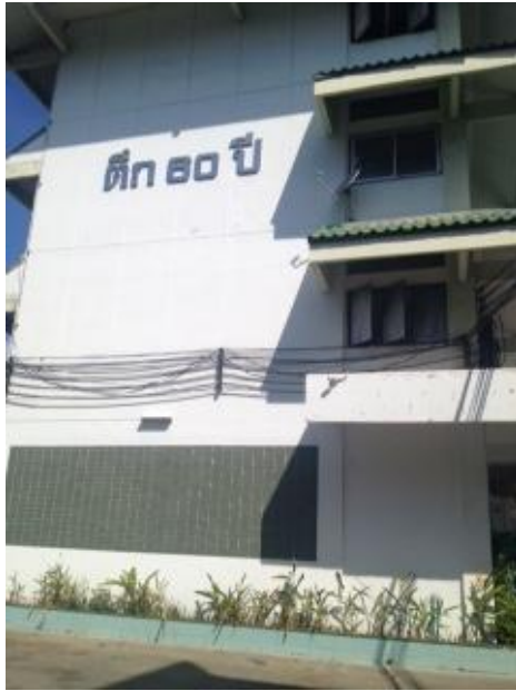
รูปห้องและเวทีทำการแข่งขัน ห้องโสตฯ ตึก 60 ปี ชั้น 2 (การแข่งขันระดับ ม.ต้น)